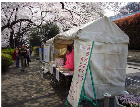
▲「さくら基金」募金活動