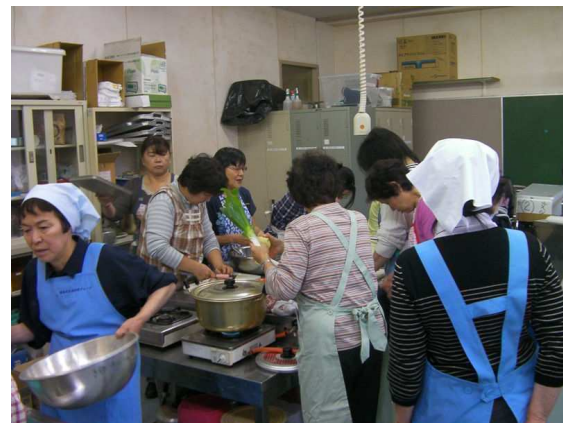
▲農業体験交流 (群馬県嬭恋村)