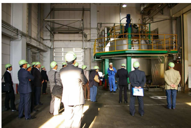
▲株式会社アルフォ城南島飼料化センター