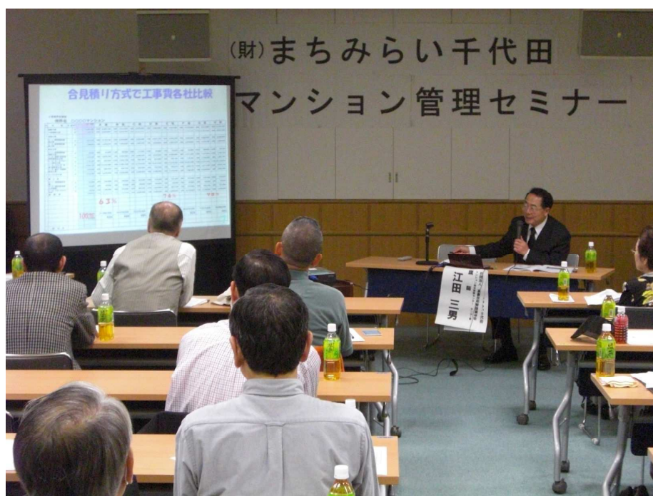
▲マンション管理セミナーの様子