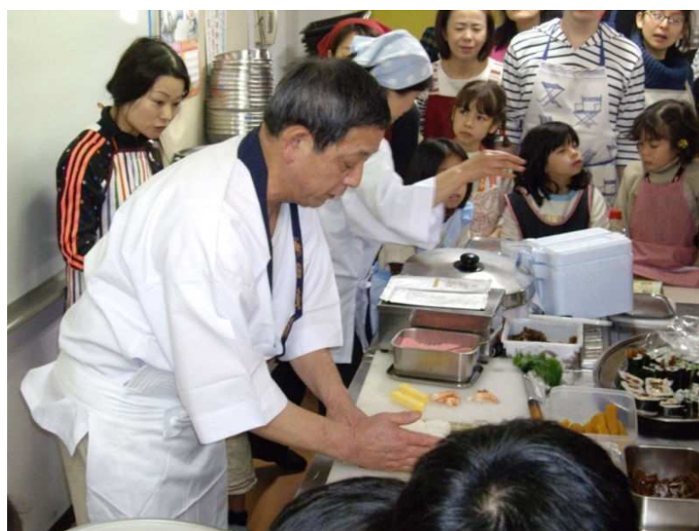
▲料理教室（巻きずし作り）