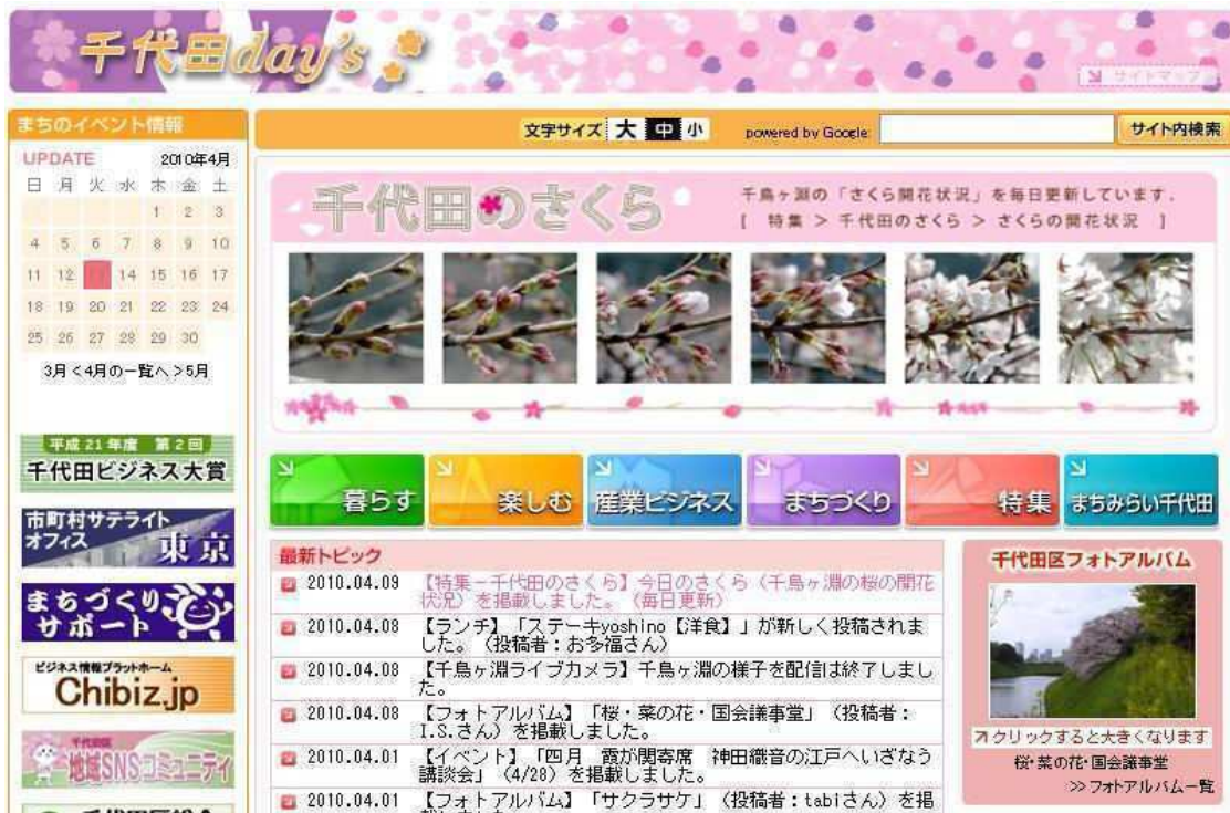
▲「千代田day's」トップページ