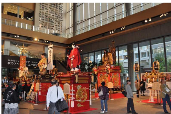
▲山車人形等の展示 (丸ビル会場)