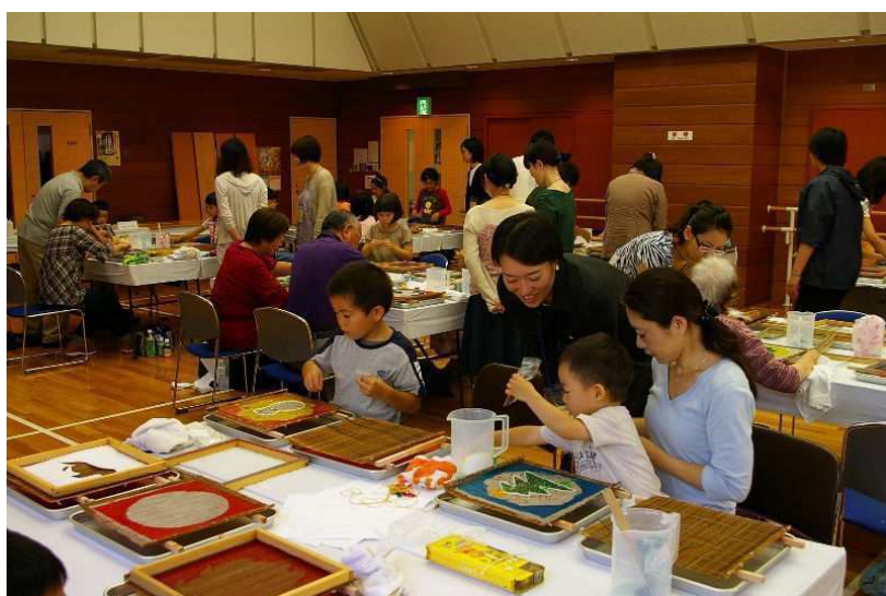
▲創作和紙ワークショップ