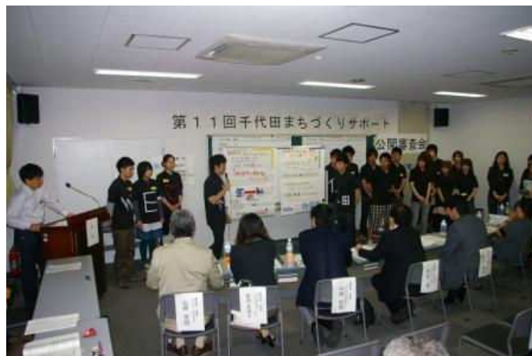
▲公開審査会の様子

神田地区のコミュニティ作りや魅力再発見などの活動を行う「神田探偵団」「神田人」「かんだもん」や、麹町地区で活動する「結びの会」「半蔵門駅通り花の会」など8つの活動に対して新たに助成が認められました。