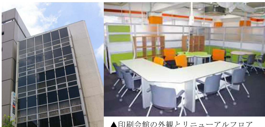
▲印刷会館の外観とリニューアルフロア

千代田印刷会館は、近年利用が大幅に減少していましたが、今後は印刷関連企業と連携できる企業等の入居により新事業の創出が期待されています。なお、年度末には満室となりました。