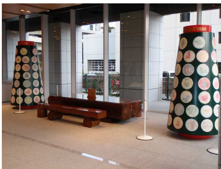
▲区役所区民ホールの展示作品