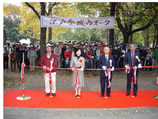
▲江戸登城ウォーク (出発式)