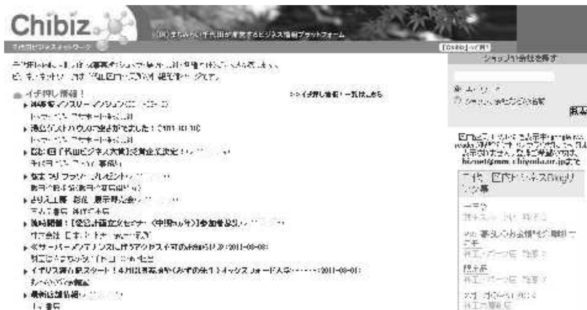
▲ビジネス情報プラットフォーム「Chibiz」

また、「千代田day's」及び「まちみらいニュース」の産業コンテンツを充実させ、中小企業経営をサポートするため、「どうする！反転攻勢の経営～景気回復の芽を伸ばせ～」を年間テーマに、一般社団法人ちよだ中小企業経営支援協会所属の中小企業診断士による「がんばる中小企業応援リレーコラム」を掲載しました。