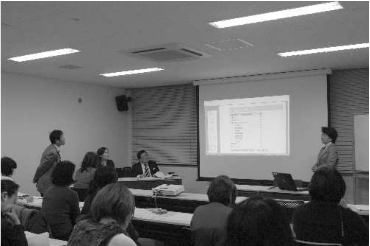
ビジネスプラン発表