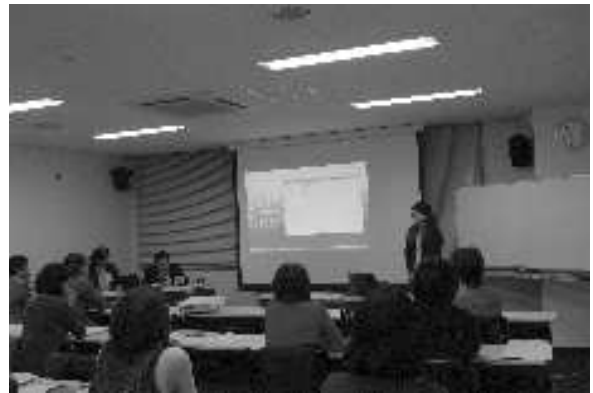
ビジネスプラン発表