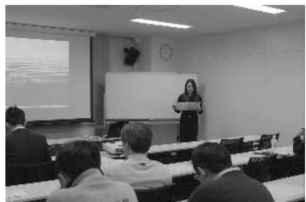
▼ビジネスプラン発表