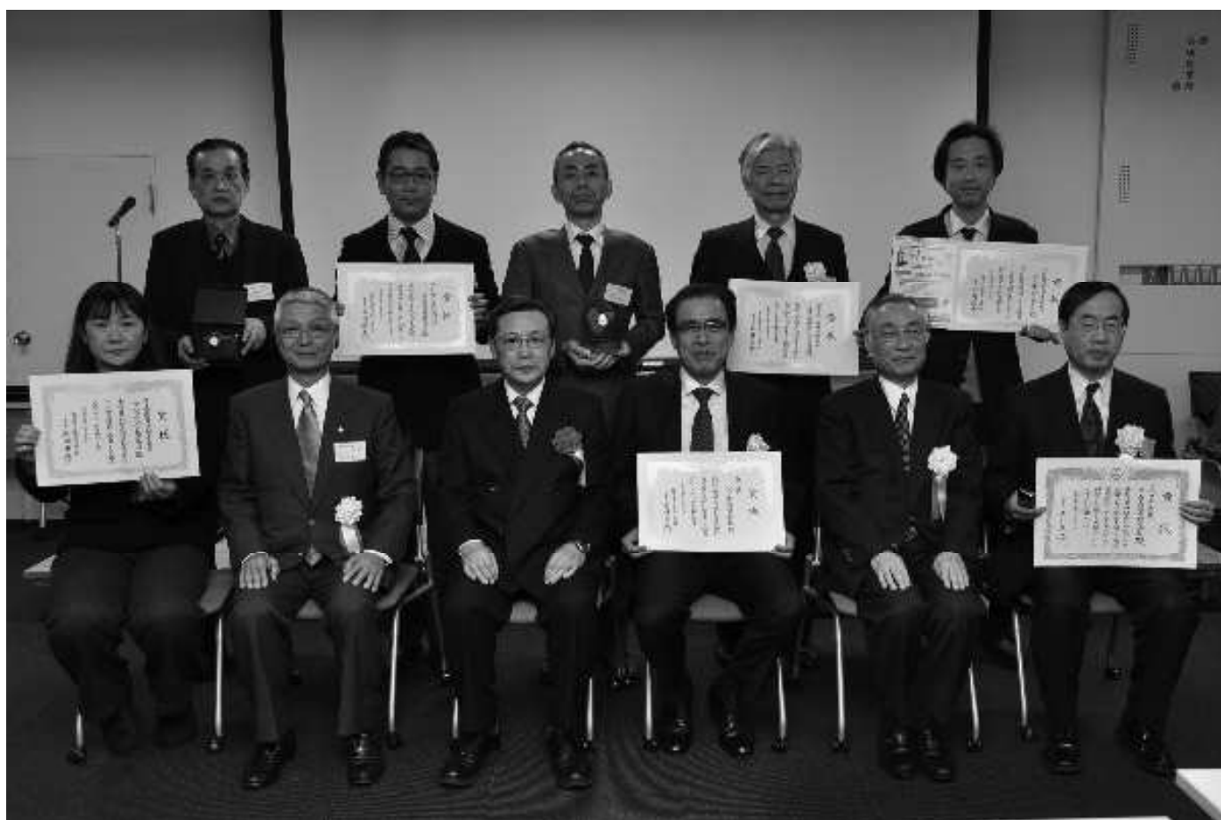
第4回千代田ビジネス大賞受賞企業