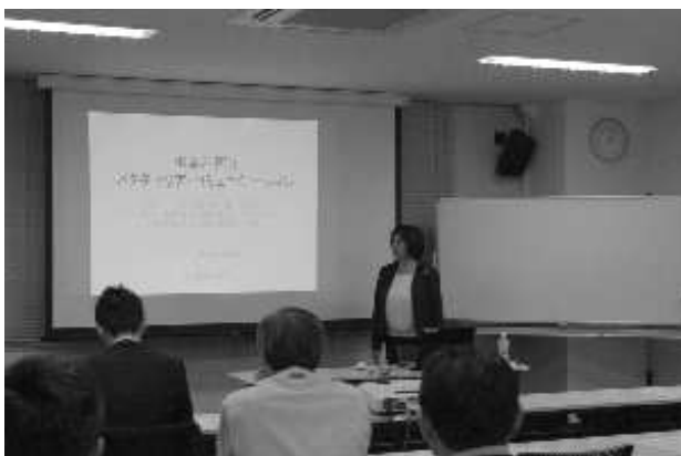
▼ビジネスプラン発表