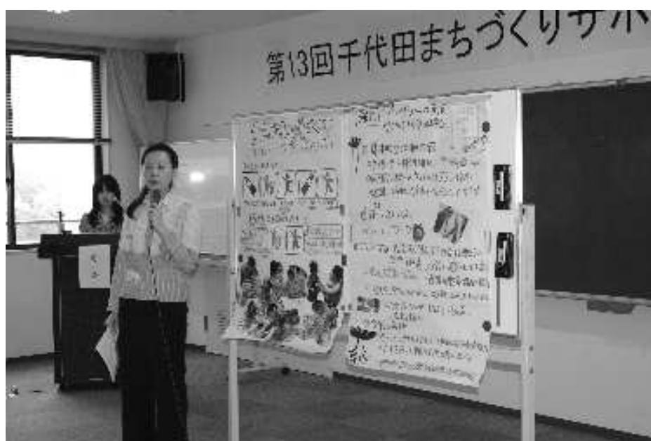
▲公開審査会の様子