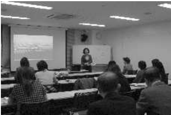
ビジネスプラン発表