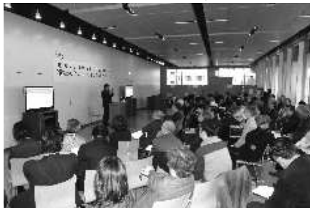
◆平成24年3月31日のマンション管理セミナー

マンション居住支援施策について、区民や有識者から、今後のあり方について意見を求め、一定の方向性をまとめました。