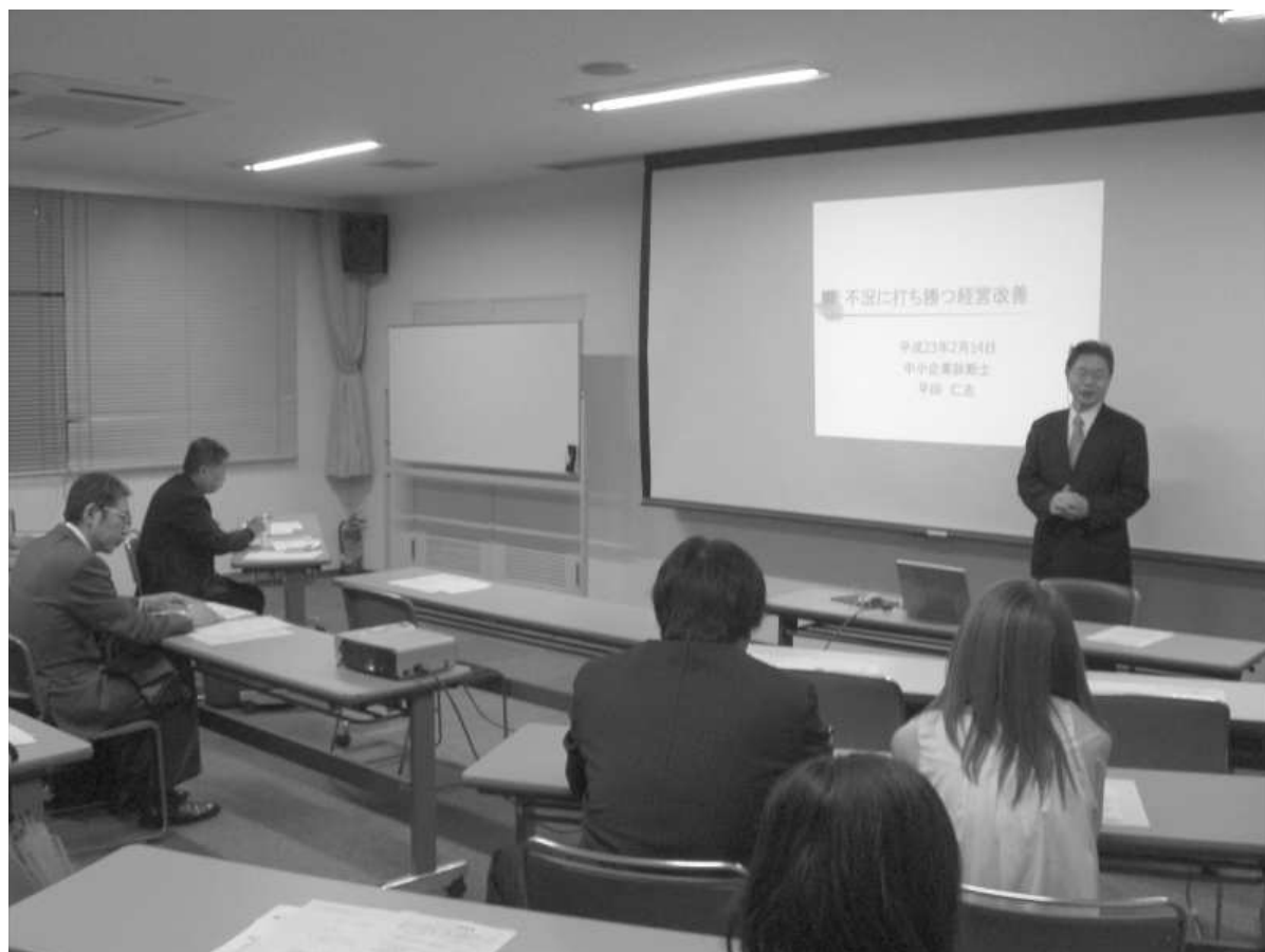
▲経営改善セミナー

一般社団法人ちよだ中小企業経営支援協会との協力による経営改善セミナーを実施し、中小企業を支援しました。