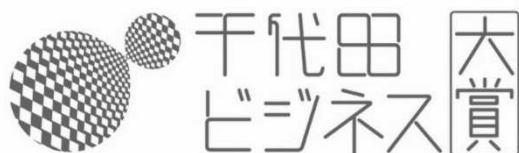
▲千代田ビジネス大賞ロゴマーク

今後とも事業の周知を図るとともに、大賞の価値向上に努力することで、更なる応募増を目指します。