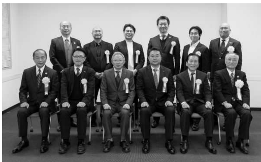
▲第11回千代田ビジネス大賞表彰式