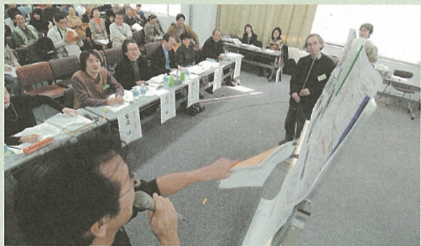
▲第6回成果発表会のようす