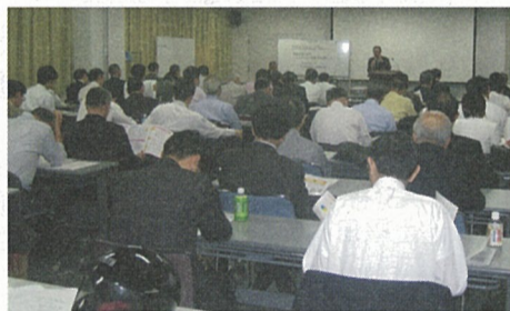
第1回オープンセミナー

なお希望者には、後日個別相談会を開催します。 とき 8月26日(金)午後3時～4時30分 会場 ちよだプラットフォームスクウェア5階会議室 定員 50名(先着順)