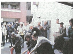
はじめて開催したマンション合同防災訓練

また、マンション等の集合住宅にお住まいの方々と周辺地域とのコミュニティの連携についても取り組んでいきます。