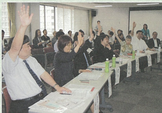
▲トライアル部門は審査員の挙手で決定。

当日は、地域の方や学生などのグループから、様々なまちづくり活動が発表され、審査委員との質疑など、熱のこもった審査が展開されました。