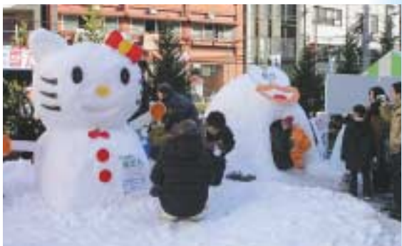
昨年の雪だるまつフェア

一流アーティスト指導のもと創作和紙のワークショップに参加してみませんか。今年5月に区民の皆さんが共同で作成した創作和紙のタピストリーが区役所新庁舎に設置されましたが、今回はひとつひとつの作品を集め、大きな「灯籠」に仕上げます。 前回参加された方も、今回初めて参加される方も、上質な芸術「紙すき」をぜひご体験ください。 とき 平成20年2月2日(土)、3日(日)午後1時から4時 会場 九段生涯学習館(九段南1-5-10) 対象 区内在住、在勤、在学者(小学生以上)100名 小学校3年生以下は保護者同伴。介助が必要な方は事前にご連絡ください。 前にご連絡ください。応募多数の場合は抽選となります。 1 ネットで、平成20年1月25日(金)までにお申込みください。 参加費 無料 申込み 郵便番号、住所、氏名、年齢、電話番号、参加希望日を明記の上、ハガキ・フлакシミリ・インターネット 問合せ 文化振興グループ FAX 3233 7557 http://www.chiyoda-days.jp