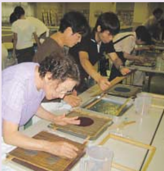
昨年のワークショップの様子