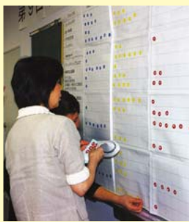
▲昨年度の一次審査の様子

※トライアル部門と一般部門の違い トライアル部門は、はじめて応募するグループを対象とした部門で、助成額は一律5万円。その後一般部門で助成を受ければ最長4年の助成が可能。一般部門は、はじめて応募するグループから継続活動グループまで誰でも応募できる部門で3年間まで継続応募が可能。各グループに5～50万円の助成を行う。