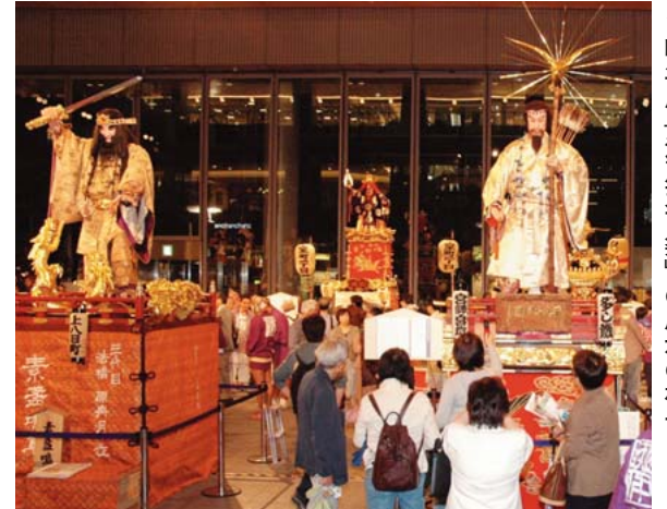
◀昨年度「江戸天下祭」の展示の様子

来年開催される「第4回江戸天下祭」の機運を盛り上げると同時に、地域間交流を推進するため、今秋「ちよだ江戸祭2008」を開催します。 問合せ 文化振興グループ