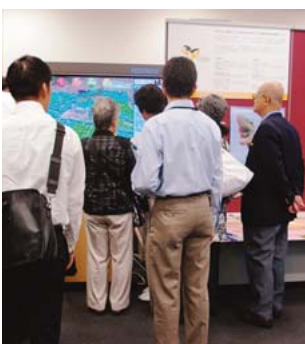
▲毎回好評のまちづくり見学会