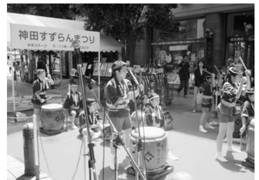
▲昨年の神田すずらんまつりのイベント風景

区内の各商店街では、それぞれ趣向を凝らした、お買い物あり、ライブありのイベントを開催します。ぜひのぞいてみてください。 ※これらのイベントは、賑わいまちづくり支援事業にて一部補助をしております。商店街の支援事業制度については、商工振興グループへお問合せください。