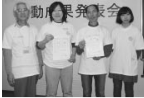
神保町応援隊のみなさん

3月7日(土)、第10回千代田まちづくりサポート活動成果発表会が開催され、助成を受けた10グループが、1年間の個性ある活動成果を発表しました。 審査員と参加団体の投票による「サポート大賞」は「よそ者と若者、町会と商店街。知恵と力を合わせて神保町を元気ある町に！」をテーマに地域コミュニティ誌「おさんぽ神保町」(第6号4万部)を発行したり、お祭りの応援をしたことで、まちの活性化に大きく貢献した「神保町応援隊」が選ばれました。 また、今回が3度目の助成とな