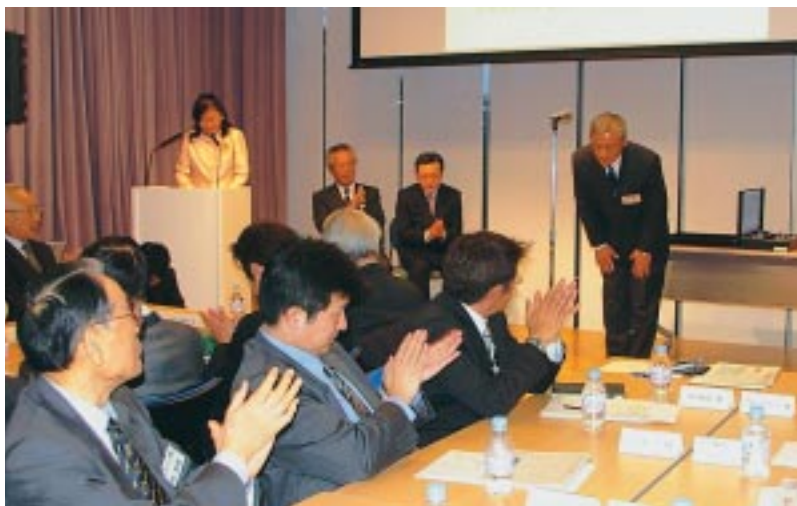
▲第一回の授賞式の様子

昨年度より新たに創設した「千代田ビジネス大賞」では、第2回の表彰企業のエントリー受付を9月1日より開始しました。今年度も、千代田の「特徴ある」「元氣な」中小企業の皆さまより、たくさんのご応募をお待ちしています。 締め切りは11月13日(金) 今年度は締め切りを11月13日