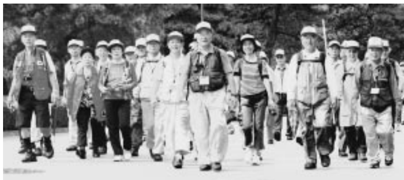
▶ 昨年のゴール間近の様子

ゴール 日比谷公園 定員 1,500名(各コース300名・申込先着順) 参加料 500円 申込み 代表者の郵便番号・住所・氏名(ふりがな)・年齢・電話番号と参加者全員の氏名・年齢・希望コース(第2希望まで必須)を記入のうえハガキかファクシミリ(〒3503-1438)で、お申し込みください。 締切り 10月30日(金)必着(ただし定員になり次第締め切ります) 問合せ・申込先 江戸登城ウオーク事務局 〒100-0011千代田区内幸町2-1-4 東京新聞企画事業部内 ☎6910-2518