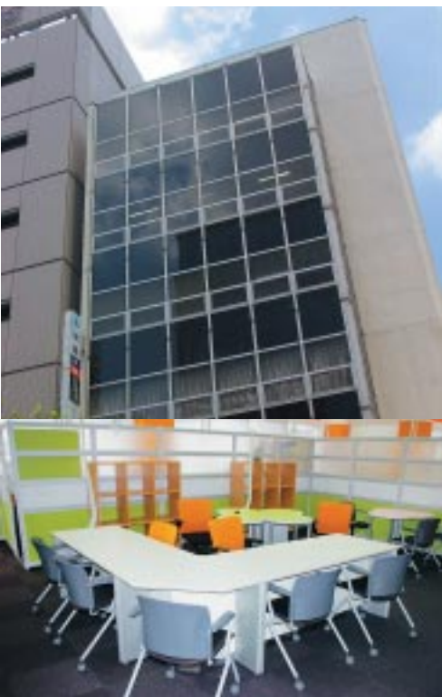
▲千代田印刷会館の外観(上)とリニューアルしたフロア(下)

◆事業内容については…まちみらい千代田商工振興グループ ☎3233-7558(直通)