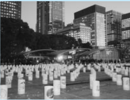
夕暮れの和田倉噴水公園

このイベントは、「地球・環境・平和」のコンセプトのもと、光のゆらめき・やすらぎ・ときめきで都会の夜を包み込む光の祭典です。