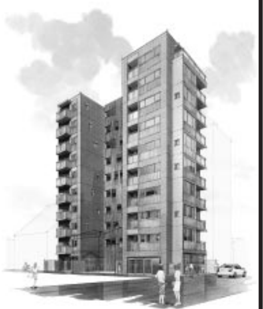
建物計画のイメージイラスト

随時個別説明会を開催中 事前にご予約ください 会場 千代田区 神田東松下町33番地 COMS HOUSE 2階