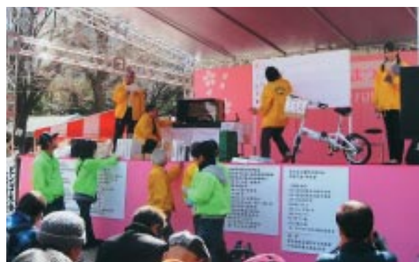
昨年のビンゴゲーム抽選会の様子

汁、カレーなどの温かいお食事や、各種名産品等を販売します。さらに、千代田区商店街連合会のブースでは、桜の時期に合わせて醸造された特別純米酒「千代田のさくら(300ml)」や桃みるく(甘酒)などを販売します。 問合せ 千代田区商店街連合会事務局 ☎5281-1171