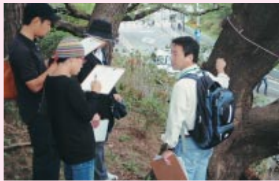
▲サポーターの活動(さくら教室)

寄付金とさくらサポーター会費の納入について 窓口払い 各出張所・千代田区道路公園課・まちみらい千代田で受け付けています。 口座振込 最寄りの金融機関より左記の口座にお振り込みください。振込手数料はおお客様の負担となります。 みずほ銀行東京都庁出張所(店番777)・普通1001313・口座名義サクラキキン 問合せ さくらサポーター事務局(千代田区道路公園課内) ☎5211-4243 さくら基金管理者(まちみらい千代田文化振興グループ) ☎3233-3222(直通)