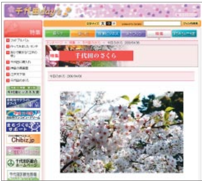
千代田day's「今日のさくら」のページ URL http://www.chiyoda-days.jp/feature/sakura/ (右のQRコードを読み取れば、携帯電話でもご覧いただけます)

今年も、いよいよお花見シーズンがやってきました。千代田区地域ポータルサイト「千代田days」では、「特集・千代田のさくら」のページを設けて今年もお花見マップやイベントなどのさくら情報をお送りしています。その中の一つである「今日のさくら」のページでは、千鳥ヶ淵のさくらの開花状況をお伝えしています。 千鳥ヶ淵周辺に260本あるさくらの中から、独自に標準木を設定し、つばみの時期から、徐々に