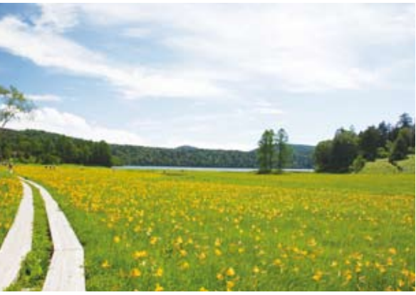
▲7月中旬のニッコウキスゲが咲く尾瀬

毎回4名のマンション管理士が待機し、1件の相談に対して、2名のマンション管理士が皆様からの相談に対応いたします。 費用は無料ですので、お気軽にお申し込みください。 ※相談は1回30分程度、予約の方を優先します。 日時 毎月第3水曜15時~17時(当日受付は16時まで) 受付 ちよだプラットフォームスクウェア(神田錦町3-21)※当日は4階まちみらい千代田事務所へお越しください。 問合せ 住宅まちづくりグループ ☎3233-13223