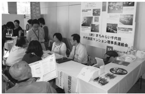
▲前回の福祉まつりの様子

まちみらい千代田もブースを出展し、マンション理事長連絡会の活動報告及び、マンション内の高齢者支援やコミュニティ活動に対し先進的に取り組んでいるマンションの紹介を行います。