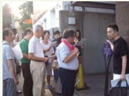
▲まちあるき調査の様子

今回のワークショップ体験記は「神田・SUM(ドットコム)」の「発見!小栗の埋蔵金発掘歴史ウォーキング」。埋蔵金!ちよとドキドキしながら参加してきました。