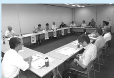
▲理事長連絡会の様子

理事長連絡会は、会員である理事長間の情報交換・意見交換の場として開催されています。