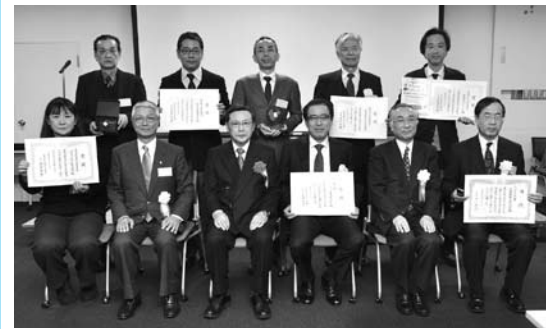
▲昨年度表彰式の様子