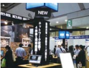
▲フォトロンM&Eソリューションズ株式会社

全国各地の大学、教育委員会、小・中・高校、塾、予備校、専門学校などの多くの関係者が出席内容に熱い注目を向ける中、第7回千代田ビジネス大賞で大賞を受賞した(株)フォトロンは、画像処理領域に特化して最高品質のハードウェアとソフトウェアを開発し、提供しています。今回の出展では、4月に(株)フォトロンの教育映像システム事業を譲り受けたフォトロンM&Eソリューションズ(株)が教育現場でのニーズに応える最新の収録配信技術を紹介しました。 第8回千代田ビジネス大賞で大賞を受賞した(株)すらネットは、「教育に変革を、子どもたちに生きる力を。」を企業理念に掲げ、最先端