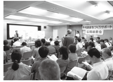
▲公開審査会の様子