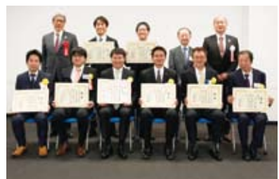
▲昨年度「第9回千代田ビジネス大賞」表彰式

「第10回千代田ビジネス大賞」のエントリー企業を募集します。 まちみらい千代田では、中小企業の発展を支援することを目的として、経営革新や経営基盤の強化に取り組んでいる企業や特徴ある優れた活動実績を上げている企業を表彰する「千代田ビジネス大賞」を実施しています。 千代田ビジネス大賞は、平成20年から始まり今年で10周年を迎え、エントリー数は累計300社以上、受賞企業は65社に上り、区内中小企業の発展に寄