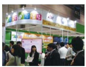
▲株式会社すらネット

のeラーニング教材「すらら」の開発・販売を行っています。また、持続可能な開発目標(SDGs)の達成に向け、スリランカやインドネシア等の教育が受けられない現地児童に対しても、eラーニングを活用した教育を提供するなど日本だけでなく世界にも目を向けた教育サービスを展開しており、今年の5月には「SDGsビジネスアワード2017」において、「Surana Digital」が評価され、「スケールアウト賞」を受賞しました。「Surana Digital」は海外用の小学生向け算数クラウド型学習システムであり、親しみやすいキャラクターや、低価格で品質の高い教育が受けられるeラーニングである点、雇用の機会を創出を目的に現地の女性をファシリテーターとして積極的に採用した点が高く評価されました。 問合せ 産業まちづくりグループ ☎ 3233317558