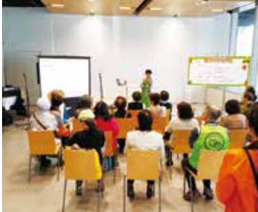
▲▼昨年の「第18回くらしの広場」の様子

「第19回くらしの広場」に まちみらい千代田ブースを出展 11月10日(金)に千代田区役所1階区民ホールにて、「第19回くらしの広場」が行われます。 今回、まちみらい千代田のブースでは、マンション支援に関する各種事業の紹介とともに、景品をご用意します。 悩みの方は、この機会にぜひお気軽にご相談ください。「くらしの広場」は、くらしに役立つ情報をパネル展示や講座等で紹介するもので、 日時 平成29年11月10日(金) 11時~14時30分 ※10時50分~オープニングセレモニーを行います。 会場 千代田区役所1階区民ホール 参加費 無料 問合せ 住宅まちづくりグループ ☎3233313223