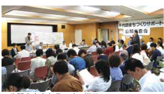
▲公開審査会(7月1日)の様子

市民の自主的なまちづくり活動を支援する「千代田まちづくりサポート」の中間発表会・普請部門二次審査を行います。 中間発表会では、今年度の助成対象13グループ(普請部門を除く)が、これまでの活動状況や今後のスケジュールについて発表します。 また、普請部門二次審査では、一次審査を通過したグループから、整備計画や建物活用方法などの提案発表が行われます。その後、実現性・継続性などの観点から審査が行われ、最大500万円の助成可否を決定します。 まちづくり活動に興味がある方はぜひご来場ください。入場、見学は無料です。 ※普請部門とは、まちづくり拠点のための空き室リノベーションや歴史的建造物などを改修改造して活用する活動等に対して助成を行う