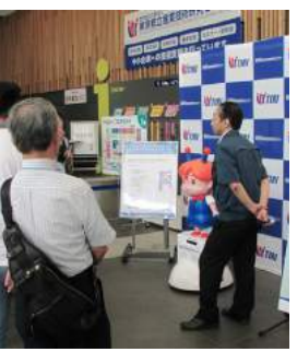
▲ロボットのデモンストレーション

地方独立行政法人東京都立産業技術研究センター本部において、平成30年5月25日(金)に一般公開イベント「INNOVESTA! 2018ビジネスデー」を開催します。 本イベントは、都産技研の技術や設備を見学・体験できるイベントです。 ビジネスデーでは、ロボットやIoT、医工連携などをテーマにした「特別講演」、さまざまな技術分野のセミナー・講習会を短時間に凝縮した「ワークショップ」、都産技研の所有する各種試験機器や設備を案内する「見学・実演・体験」などの中小企業向けプログラムを実施します。 ■日時 5月25日(金)10時～17時 ■開催場所 東京都立産業技術研究センター本部(江東区青海2-4-10) ■参加費 無料 ■参加方法 一部事前予約制。特設Webサイトからお申込みください。 ■問合せ 「イノベスタ2018」運営事務局 ☎5489-7385 http://www.tri-innovesta.jp/