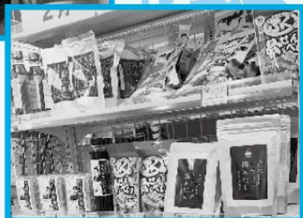
骨せんべい、雑炊の素など