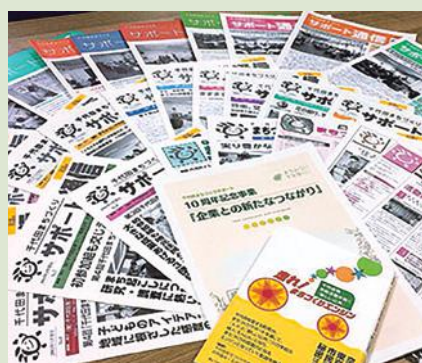
▲ウェブサイトではバックナンバーもご覧いただけます

まちみらい千代田ウェブサイトでも公開しています。右記二次元コードからアクセスください。