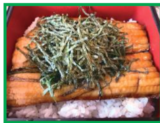
サヨリのかば焼き