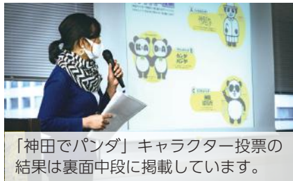
「神田でパンダ」キャラクター投票の結果は裏面中段に掲載しています。