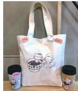
▲神田珈琲園の常連客であるイラストレーターの方が作成したグッズ。売り上げの一部が保護猫団体に寄付されます(現在企画進行中)。