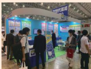
▲当日の出展ブースの様子

昨今では、新しい生活様式が浸透し、マスクはなくてはならないものとなっています。玉川衛材のマスクが、コロナだけでなく、インフルエンザや風邪予防などさまざまな機会でも活躍し、私たちの頼れる隣人として日々の生活をサポートしています。