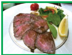
佐賀牛のローストビーフ

発展してきた街並みと、山や海といった豊かな自然を有する魅力あふれる佐賀市には、代々受け継がれた名産品が多種多様にあります。佐賀海苔や佐賀牛、さまざまな海産物や柚子胡椒の名品、郷土菓子の丸ぼうろ、数々の銘酒も有名です。佐賀市の魅力あふれる産品をお楽しみに。