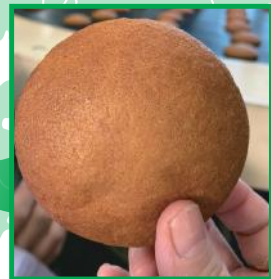
郷土菓子の丸ぼうろ