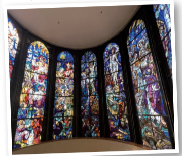
▼ 聖イグナチオ教会の ステンドグラス