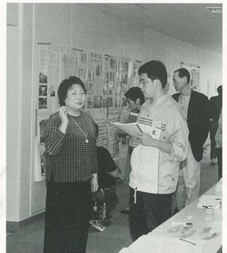
鋭い質問にも答えて…