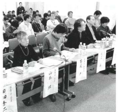
市民とのかかわりぶりも見逃さない審査委員

助成を受けて初年度の7団体(うち「千代田区民音楽協会」は欠席し6月予定の公開審査会で報告)の中で「若き日の歌・校歌の旅人」は、区内の学校の校歌集をまとめ、地域の歴史を偲ばせる成果をあげ、サポート大賞を受賞した。次年度に文化の掘り起こしが期待された。